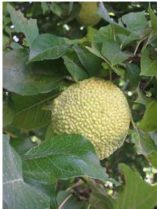
Hojas y fruto de Maclura pomifera