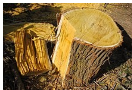
Madera característica de Maclura