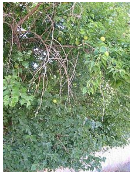
Vista de la planta