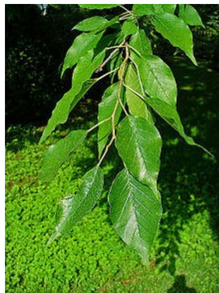
Detalle de las hojas