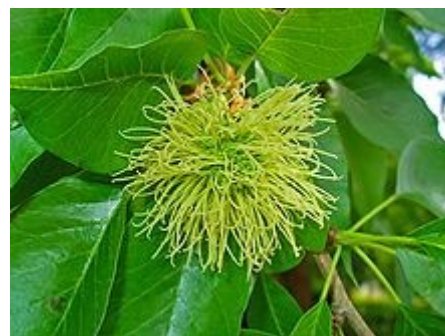
Detalle de la planta