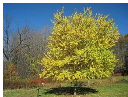
Vista del árbol